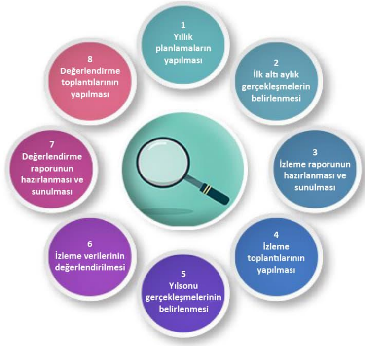
Şekil-İzleme ve Değerlendirme Süreci

İzleme ve değerlendirme sürecinin işleyişi ana hatları ile yukarıdaki şekilde özetlenmiştir.